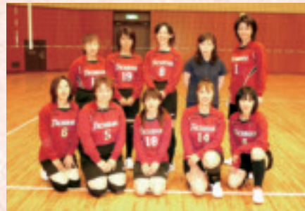
筆者は後列右から2人目

今年度から、55歳以上のシニア枠が新たにできたので、私も55歳になったらシニアでもがんばれるよう、仕事もバレーボールも、後輩を育成し、自分の能力低下防止と体力低下防止にますます励みたいと思っております。